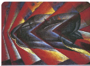
Dinamismo de un automóvil de Luigi Russolo