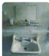
Sink and Mirror by Antonio Lopez