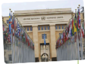
El Palacio de las Naciones Unidas en Ginebra, Suiza.

3 Entre 1914 y 1945 se produjeron dos guerras: la Primera y la Segunda Guerra Mundial, con un periodo de tiempo entre ambas. Al finalizar la Segunda Guerra Mundial se creó la ONU para mantener la paz entre los países.