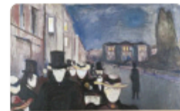
Spring Evening by Edvard Munch