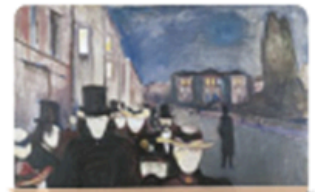
Tarde de primavera de Edvard Munch