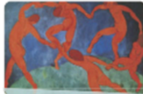
Danza de Henri Matisse