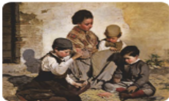
Chicos jugando a las cartas. Rafael Romero Barros, 1868.

The nobles had privileges and became wealthy because they owned most of the land. By the end of the century, industrialists and merchants managed to become richer than the nobles.