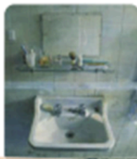
Lavabo y espejo de Antonio López