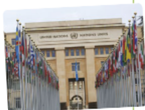
The United Nations Palace in Geneva, Switzerland.

3 Between 1914 and 1945, there were two wars: World War I and World War II , with a period of time between them. At the end of the Second World War, the UN was created to keep the peace between countries.