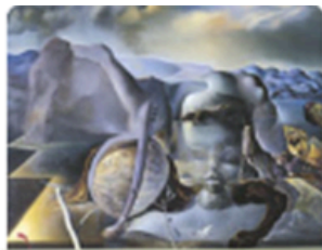
El enigma sin fin de Salvador Dalí