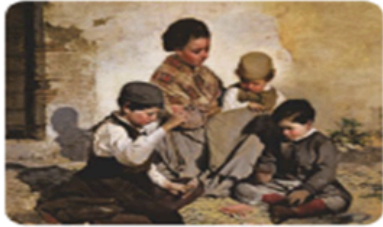
Chicos jugando a las cartas. Rafael Romero Barros, 1868.

Los nobles tenían privilegios y se enriquecieron porque poseían la mayor parte de las tierras. A finales de siglo, los industriales y comerciantes lograron ser más ricos que los nobles.