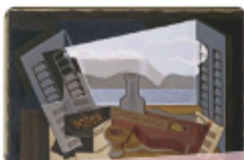
The Open Window by Juan Gris