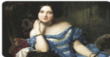
Amalia de Llano, Countess of Vilches. Madrazo and Kuntz, 1853.

The nobles had privileges and became wealthy because they owned most of the land. By the end of the century, industrialists and merchants managed to become richer than the nobles.