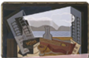
La ventana abierta de Juan Gris