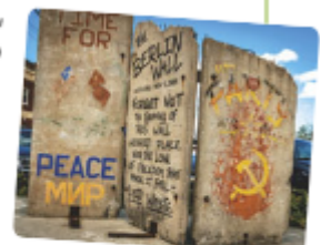
A sector from the Berlin Wall.

4 Between 1945 and 1990, the world was divided into two blocks with different political ideas: the communist block and the capitalist one. At the end of the 20th century, the world was globalized until it was configured as we know it nowadays.