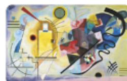
Yellow, Red and Blue by Wassily Kandinsky