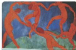
Dance by Henri Matisse