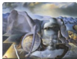
The Endless Enigma by Salvador Dali