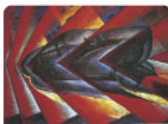
Dynamism of a Car by Luigi Russolo