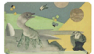
Amenaza en el prado verde de Hannah Höch