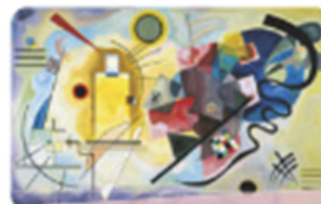
Amarillo, rojo y azul de Wassily Kandinsky