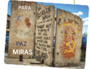
Un sector del Muro de Berlín.

4 Entre 1945 y 1990, el mundo se dividió en dos bloques con ideas políticas diferentes: el bloque comunista y el capitalista. A finales del siglo XX, el mundo se globalizó hasta configurarse como lo conocemos hoy en día.