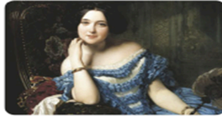
Amalia de Llano, Countess of Vilches. Madrazo and Kuntz, 1853.

Los nobles tenían privilegios y se enriquecieron porque poseían la mayor parte de las tierras. A finales de siglo, los industriales y comerciantes lograron ser más ricos que los nobles.